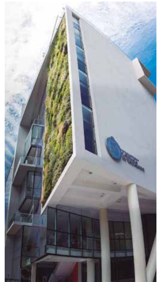
Sede Providencia PUCV, Santiago